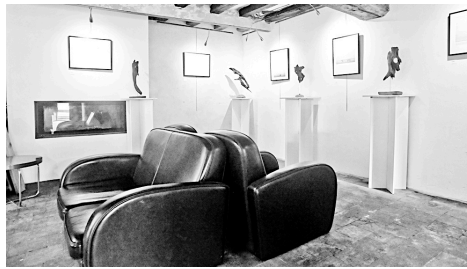
L'espace salon de la galerie