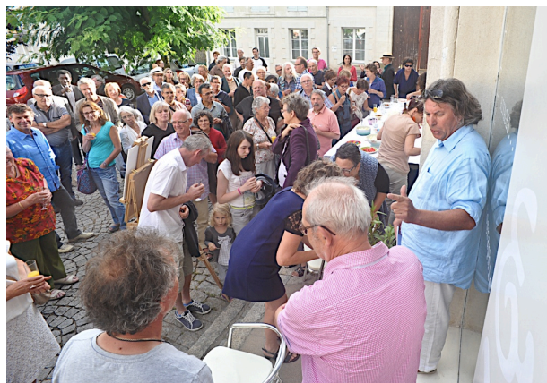
Une palette d'invités dans la rue

La Galerie ÉPI est également un lieu de création car l'autre objectif est d'inviter des artistes étrangers en résidence. « Leur regard sur la Loire nous apportera certainement une vue nouvelle sur celle-ci et donc sur nous-même »... « Ce regard de l'autre n'est-il pas tout simplement notre miroir ».